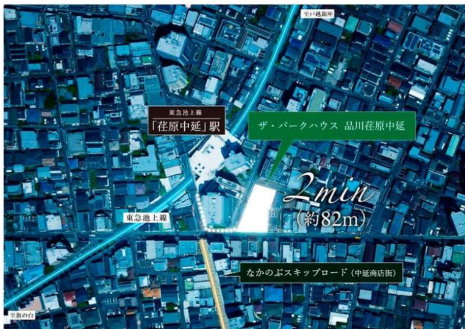
現地周辺航空写真（掲載の航空写真は2024年6月に撮影しCG加工を施したもので、実際とは多少異なります。）

本物件所在地は、東京都が不燃化推進特定整備地区に位置付け、品川区が密集住宅市街地整備促進事業を導入するなど老朽建物の建替えや未接道宅地の解消といった防災の早期改善が望まれるエリアです。首都圏不燃建築公社と三菱地所レジデンスは、約800㎡規模での開発を通じ、火災や地震の発生時の延焼防止、安全な避難経路の確保、都市型住宅への整備、細分化された土地や狭あい道路の拡幅整備、快適な歩行者空間や緑化空間の創造を目的として事業を推進します。