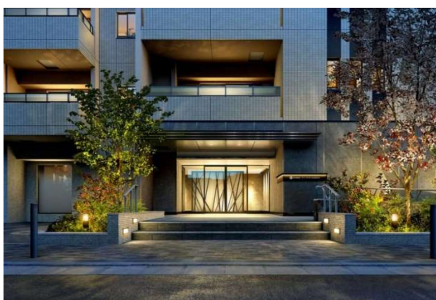
▲エントランス完成予想 CG

首都圏不燃建築公社と三菱地所レジデンスは、まちの課題解決に取り組み、安心・安全で住み心地のよい住まいづくり、まちづくりに取り組んできた経験を活かし、今後も事業を推進してまいります。