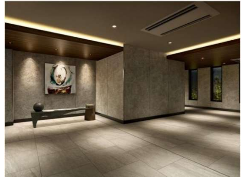
▲エントランスホール完成予想CG

所在地：東京都品川区東中延1丁目500番（地番） 交通：東急池上線「荏原中延」駅（駅舎）徒歩2分、東急大井町線「中延」駅（駅舎）徒歩6分、都営浅草線「中延」駅（A3出口）徒歩7分、東急大井町線「戸越公園」駅（南口）徒歩8分 敷地面積：802.48㎡（売買対象面積）、802.47㎡（建築確認対象面積） 建築面積：361.49㎡ 延べ床面積：4,199.73㎡ 構造・規模：鉄筋コンクリート造 地上14階地下1階建 総戸数：63戸（募集対象外住戸17戸含む） 専有面積：34.63㎡～67.22㎡ 間取り：1LDK～3LDK 販売価格：未定 設計：株式会社ユーデーコンサルタンツ 施工：川口土木建築工業株式会社 竣工：2026年1月下旬（予定） 入居：2026年3月中旬（予定） 売主：一般財団法人首都圏不燃建築公社 三菱地所レジデンス株式会社 販売スケジュール：【第1期26戸】2024年12月6日（金）販売開始